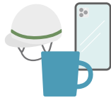
プリントする素材