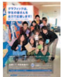
一例：雑誌Mdn掲載広告